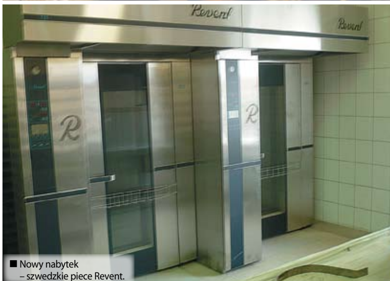
■ Nowy nabytek – szwedzkie piece Revent.