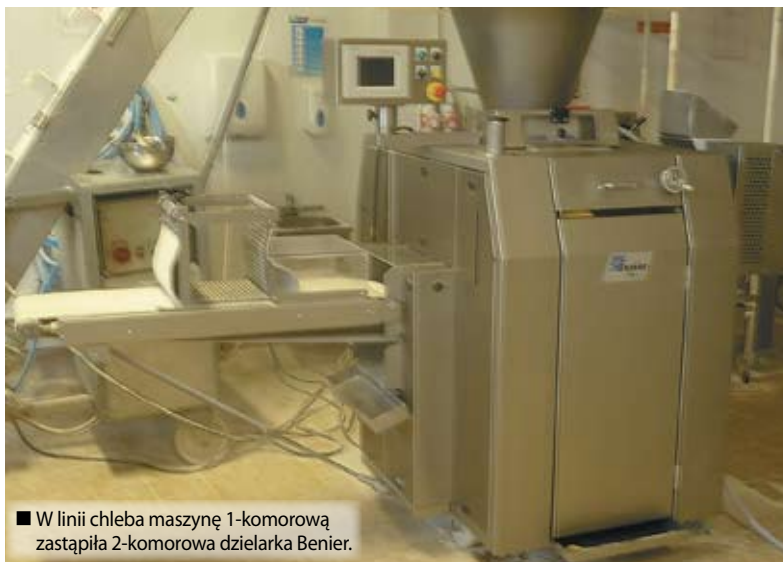
■ W linii chleba maszynę 1-komorową zastąpiła 2-komorowa dzielarka Benier.

więcej informacji na: www.peters-nurkowski.pl